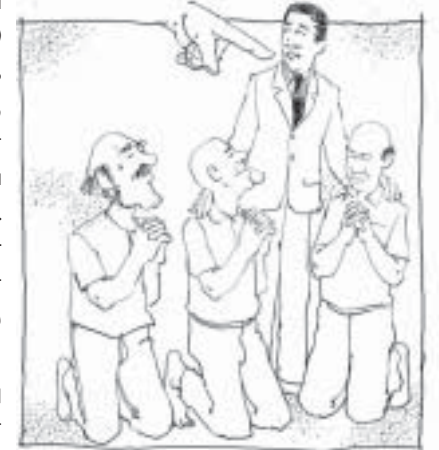
கர்த்தருக்குக் கீழ்ப்படிவதற்கே முதலிடம் கொடுக்க வேண்டும்

C. எண்ணாகமம் 11:16-30 - மூப்பர்கள். இஸ்ரவேலர் சுற்றித்திரியும்போது தேவன் தமது ஆவியை 70 மூப்பர்கள் மேல் வைத்தார். உடனே அவர்கள் தீர்க்கதரிசனம் உரைத்தார்கள் என்ற சம்பவம் வேதத்தில் எழுதப்பட்டுள்ளது (வசனம் 25) கர்த்தருடைய ஆசரிப்புக் கூடாரத்தில் கூடியிருந்த மற்றவர்களோடு இரண்டுபேர் இல்லை. அவர்கள் பாளையத்தில் இருந்துவிட்டார்கள். அந்த ஆவி அவர்கள் மேலும் வந்து தங்கின மாதிரித்தீர்ந்த தீர்க்கதரிசனம் சொன்னார்கள் (வசனம் 26)