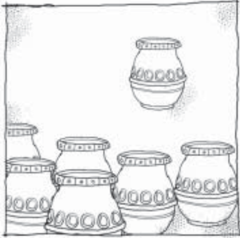
பரிசுத்தமாக்கப்படுதல்: பரிசுத்த பயன்படுத்துதலுக்காகப் பிரித்தெடுக்கப்படுதல்

பரிசுத்தமாக்கப்படுதலுக்கு இரண்டாவது அர்த்தம் சுத்திகரிக்கப் படுதல் என்பதாகும் - நல்லொழுக்கரீதியற்ற நிலையிலிருந்து எடுத்து சுத்திகரித்து, தூய்மைப்படுத்தப்படுவதாகும். எடுத்துக்காட்டாக, பவுல்