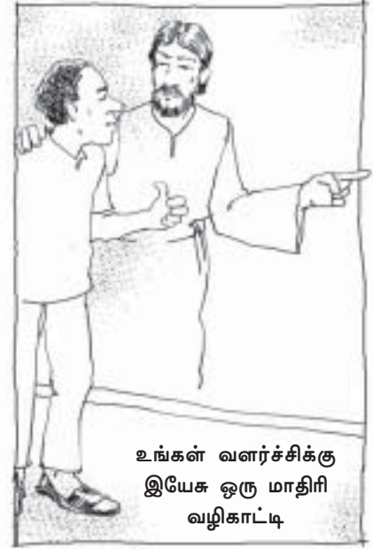
உங்கள் வளர்ச்சிக்கூ இயேசு ஒரு மாதிரி வழிகாட்டி

நாம் ஒரு தலைவராய் இருந்தாலும் சமுதாயத்தில் உள்ள அதிகார அமைப்பிற்கு கீழ்ப்படிய வேண்டும் என்று வேதம் போதிக்கிறது. அரசாங்கம், அதன் பல பிரிவுகள், சபைகள், வேலைகள் எல்லாவற்றிலும் அதிகாரத்திற்குட்பட்ட அமைப்பு இருக்கிறது.