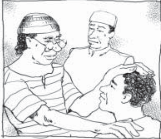
தேவனுடைய ஊழியத்துக்காக நியமிக்கப்பட்டவர்

தீமோத்தேயுவின் மேல் வைத்து ஜெபித்தவுடன் பரிசுத்த ஆவியானவர் தேவனுடைய சித்தத்தை அவர்கள் மூலம் வெளிப்படுத்தி தீர்க்கதரிசனமாக தீமோத்தேயுவின் வாழ்க்கைக்கு தேவனுடைய அழைப்பையும் விருப்பத்தையும்