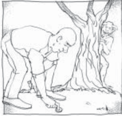
சாத்தான் நெடுங்காலமாய் மனிதப் பண்புகளைக் கருத்துடன் கவனித்துக் கொண்டிருப்பவன்

நாம் இயேசுகிறிஸ்துவுடன் தொடர்ந்து வளருகின்ற உறவை அசட்டை பண்ணும்போது நாம் சாத்தானின் தந்திரங்களினால் மிக எளிதில் காயமடைவோம் என்பதை நினைவில் வைத்துக்