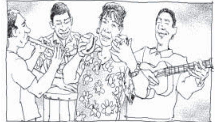
சபை : மனதிற்கு இசைவான முழுமை....

இது கர்த்தருடைய பிள்ளைகளிடையே ஐக்கியம் தேவை அல்லது இன்றியமையாதது என்பதற்கு அடையாளமாக இருக்கிறது. வேதம் அபிஷேகம், ஐக்கியம் இரண்டையும் இணைத்து அழகான விதத்தில் முன்னிறுத்துகிறது. “இதோ சகோதரர் ஒருமித்து வாசம் பண்ணுகிறது.