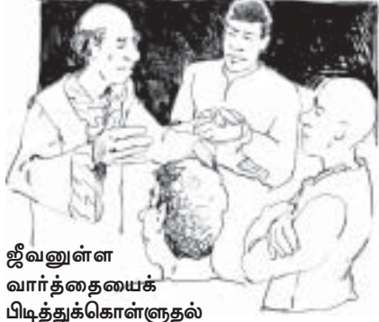
ஜீவனுள்ள வார்த்தையைக் பிடித்துக்கொள்ளுதல்

அழிவுகளைச் சுற்றிப் பார்க்கிறார்கள். இப்போது இந்த இடங்கள் ஜீவனில்லாதவையாக, சுவிசேஷத்தின் வல்லமை இல்லாதவையாகக் காணப்படுகின்றன.