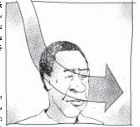
பரிசுத்த ஆவியானவர் நம்மை சரியான உறவுக்குள் வழிநடத்துவார்.

தேவன் உறவுகளுக்கு அதிக முக்கியத்துவம் கொடுக்கிறார். மனிதனுடைய பாவத்தினால் தேவனுக்கும் மனிதனுக்கும் உள்ள